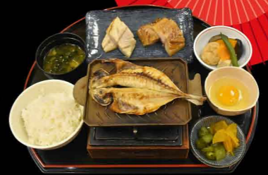
おまかせ干物膳 1,300円