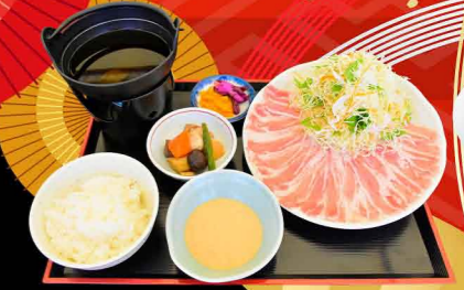
ふじのくにポークしゃぶしゃぶ膳 1,500円