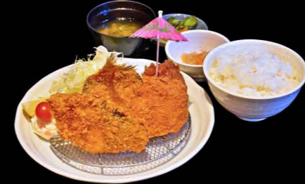
3種の地魚フライ膳 1,550円