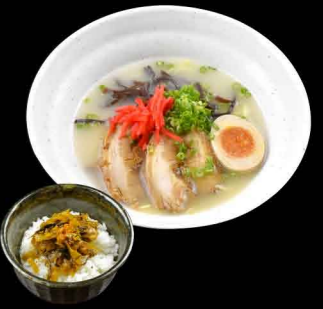
九州とんこつラーメン 1,100円 高菜丼付き 1,250円