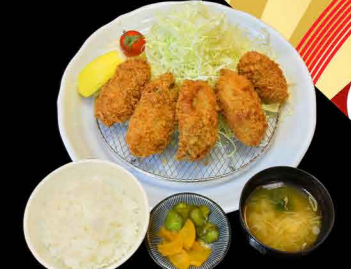
広島県産カキフライ膳 1,550円