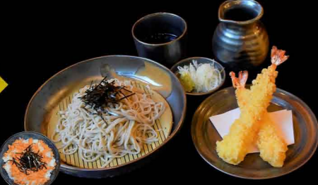
えび天ざるそば 1,300円、ミニ丼付き 1,450円