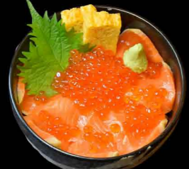
いくらサーモン丼 1,800円