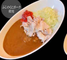
しゃぶしゃぶ肉カレー 1,300円