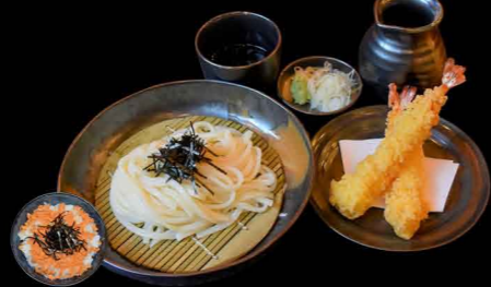
えび天ざるうどん 1,300円、ミニ丼付き 1,450円