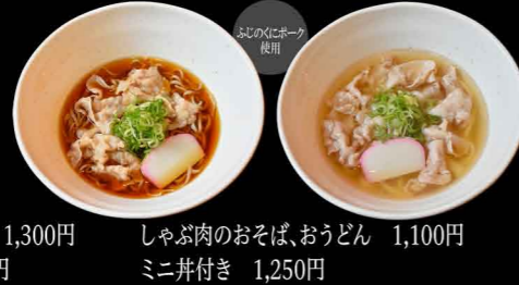
しゃぶ肉のおそば、うどん 1,100円 ミニ丼付き 1,250円