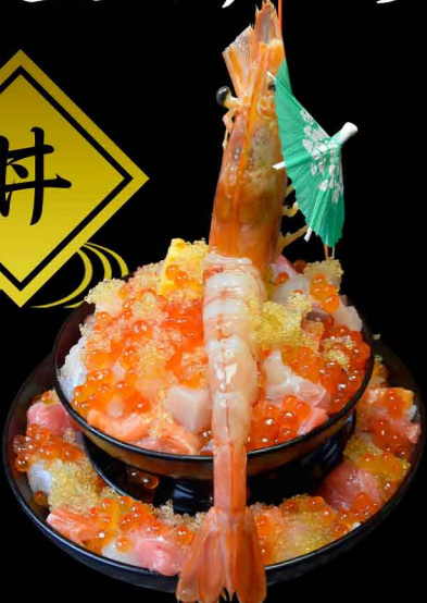
海鮮丼 ~頂itadaki~ 3,300円