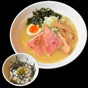
金目塩ラーメン 1,200円 わさびライス付き 1,350円