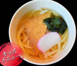
お子様うどん(温・冷) 700円