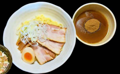
魚介チャーシューつけめん 1,200円 チャーシュー丼付き 1,350円