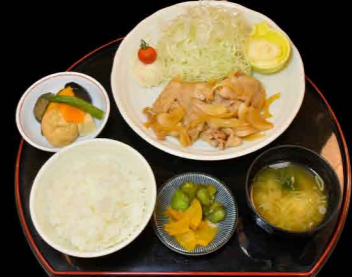
ふじのくにポーク生姜焼き膳 1,500円