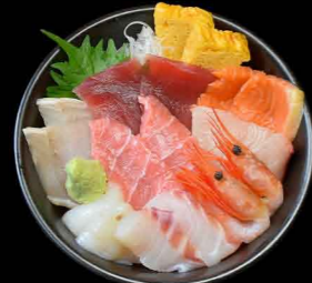
おまかせ海鮮丼 1,900円