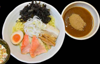
金目鯛つけめん 1,200円 チャーシュー丼付き 1,350円