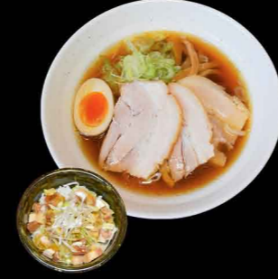
チャーシューメン 1,200円 チャーシュー丼付き 1,350円