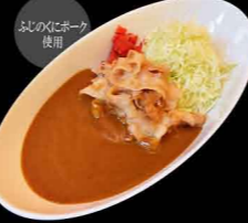
豚生姜焼きカレー 1,300円